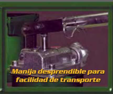
Manija desprendible para facilidad de transporte