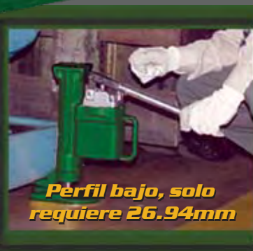
Perfil bajo, solo requiere 26.94mm