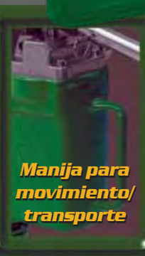
Manija para movimiento/ transporte