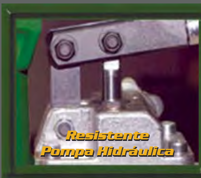
Resistente Pompa Hidráulica

Disponible en modelos de 5, 10 y 25 toneladas métricas